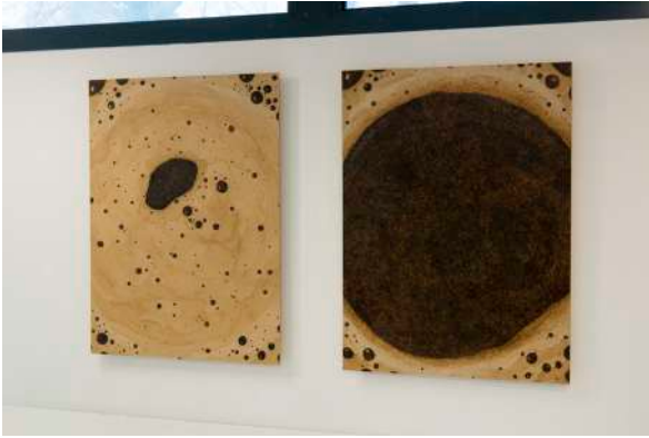
Mousses (2023) Pyrogravures sur médium rehaussées au café instantané. 80x60x3cm

Agissant comme des fragments d'une histoire, ces objets apportent une dimension parfois ludique mais toujours absurde à ce monde du travail où les enjeux sont parfois difficiles à saisir et sa place compliquée à trouver.