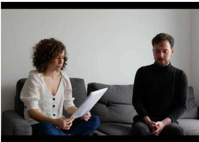
The training (2020)

Installation 22 multiples en acier, 21x29,7cm Installation variable