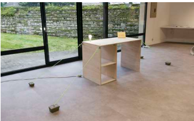
Flex office (2023) Installation Bois, pyrogravure sur bois, équerres en métal, vis, anneaux, corde de camping phosphorescentes, terre crue, fil électrique, interrupteur, ampoule Bureau 120x75x60cm dimensions variables