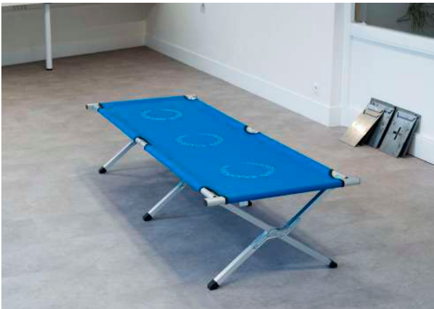
Se reposer sur ses lauriers (2023) Lit de camp, peinture textile 190x73x42 cm