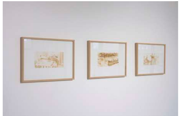
Série Breakroom (2023) Café instantané sur papier 3 cadres format 21x29,7cm 1 cadre format 29,7x42