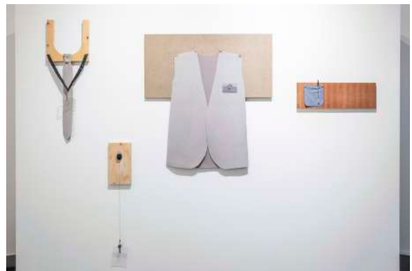
Série Name tag (2022-23) Installation Tissus, bois, vis, tour de cou porte nom, badge, stylo, clé