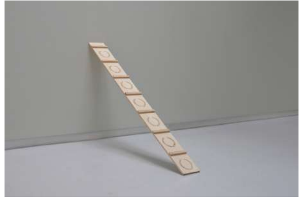
Au boulot ! Ramp to success (2023) Installation Pyrogravure sur contreplaqué de sapin, barreaux en sapin, clous 240x20x5