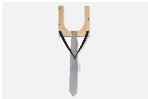
Name tag - Cravate (2022)

Performance et bande sonore Harnais et niveau laser