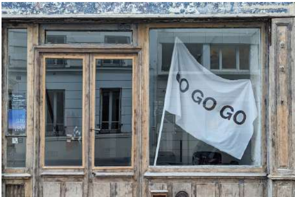
Le manager (2020)

L'exposition plutôt pensée dans le cadre d'une présentation en lycée gravitera autour de plusieurs éléments renvoyant aux questions liées aux réalités sociales de l'artiste-auteur et du monde du travail. Cette exposition mêlant œuvres-tutoriels, vidéos, installations et objets graphiques se retrouve au centre de plusieurs recherches sociales, économiques, formelles et sociologiques, interrogeant la réalité de l'activité artistique et de sa place dans la société, en tirant les différentes ficelles de deux mondes s'entrechoquant, celui du travail et de l'art.