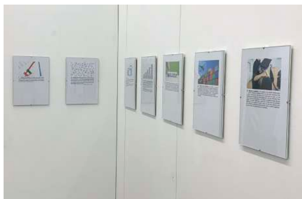
How to become an artist in France ? (2020-...)