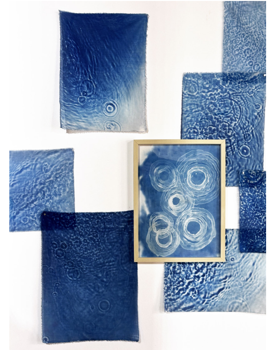
1. Dessin, feutre et lavis, 24x32cm, encadré / 2. Dessin, lavis encre de Chine, 20x30cm, encadré / 3. Dessin, lavis encre de Chine, 30x40 cm, encadré / 4.5 et 6. Dessins, lavis, 24x32cm, encadrés / 7. Tirage cyanotype sur papier Sumi-e encadré 30x40 cm et tirages sur organdi 30x40cm et 20x30 cm