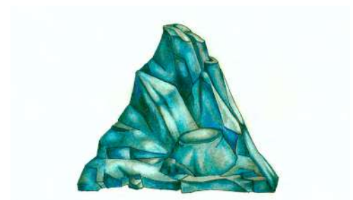
Pierres de rêves 2013 bois peint, céramique émaillée, papier marbré, cuir, cailloux, crayon de couleur sur papier, acier peint boîte fermée : 40 x 34 35 cm, dessin : 24 x 30 cm