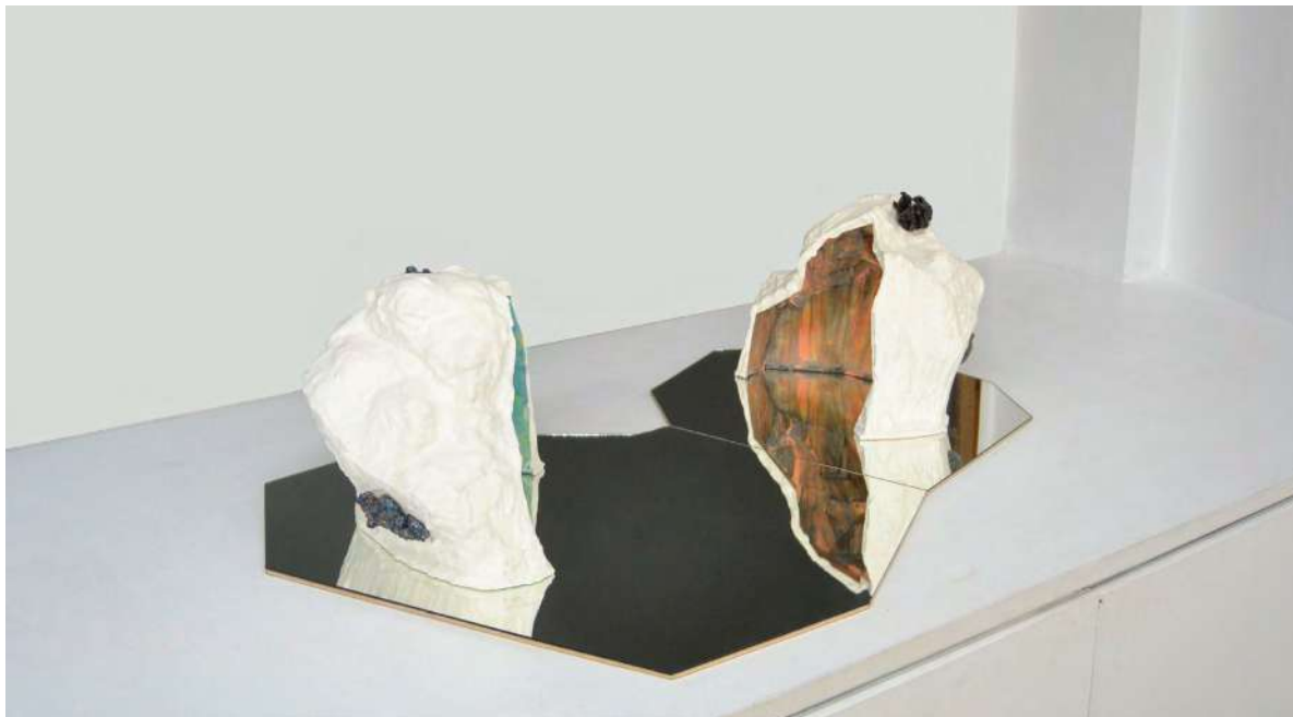
Sans titre 2017 plâtre coloré, céramique émaillée, miroir