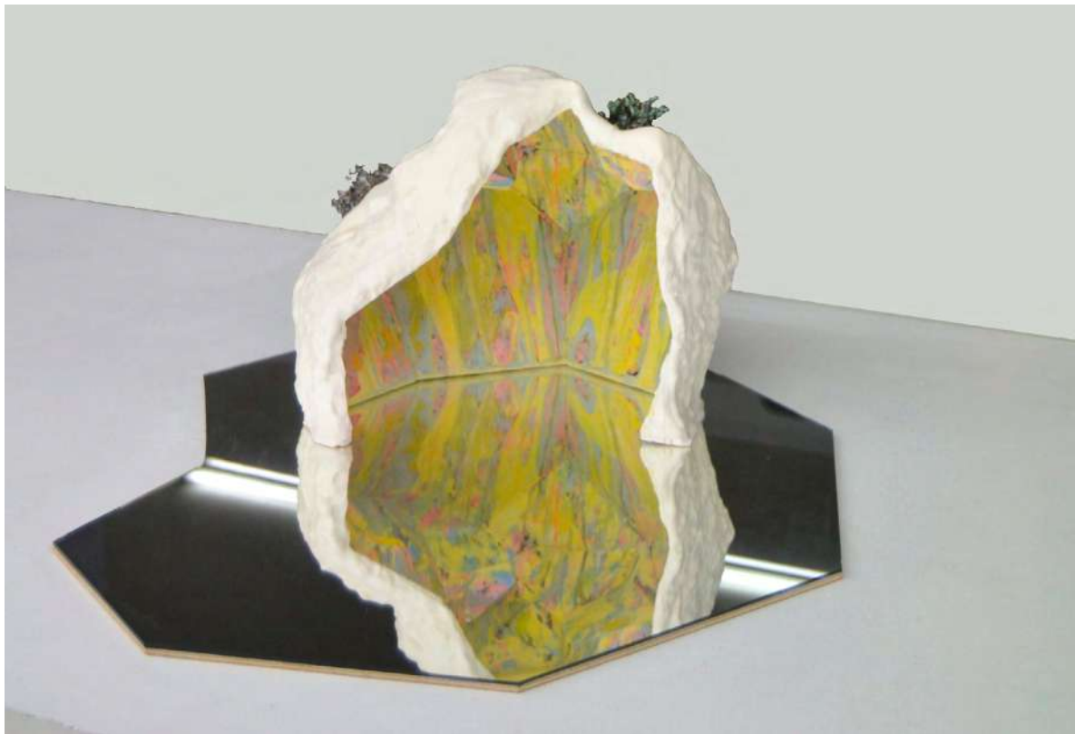
Sans titre 2017 plâtre coloré, céramique émaillée, miroir